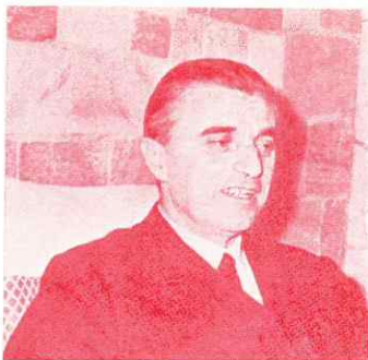
Il prof. E. Medi