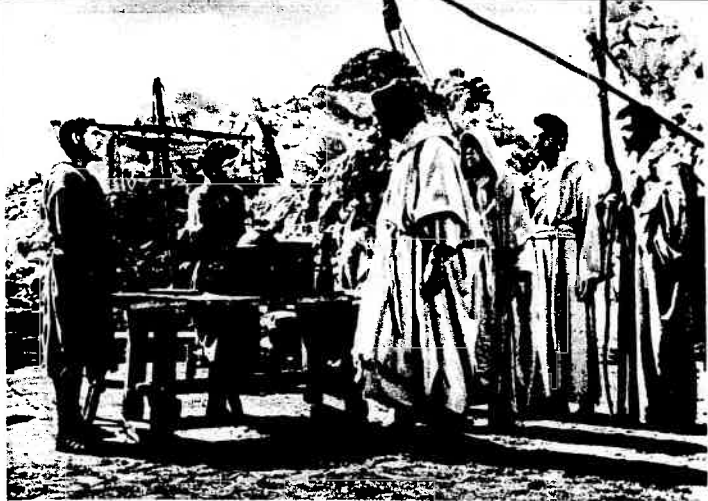
Gesù chiama tra i suoi dodici apostoli il pubblicano Matteo che faceva l'esattore delle tasse per i conquistatori romani.