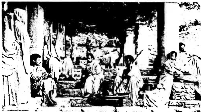
Riparato all'ombra d'un pergolato, Gesù ammaestra i suoi dodici apostoli nell'arsura del torrido pomeriggio palestinese.

nella desolata solitudine, il grido di Gesù che — proprio sulla croce — chiede al Padre perchè l'abbia abbandonato! Molte volte fu chiesto a Gesù: « Sei proprio il Cristo? ». Ed Egli aveva risposto ai suoi discepoli con la domanda: « Chi dite voi ch'io sia? ». Nel porre tale domanda, Egli chiedeva loro molto più che una professione di fede; indicava la stra-