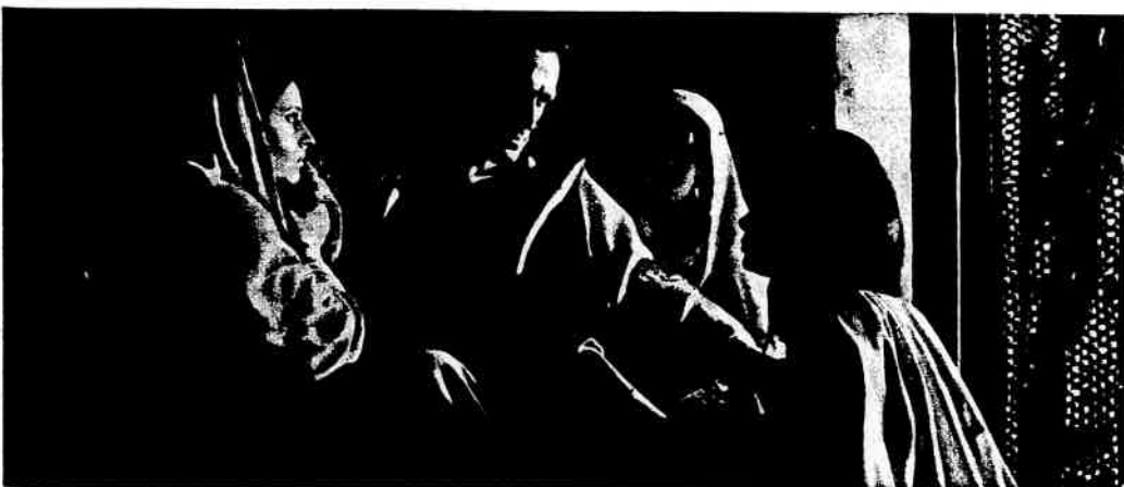
Gesù tra i fanciulli (foto a sinistra) e con un gruppo di giovani pie donne (qui sopra). Il film ha tra gli interpreti gli attori più famosi del mondo: Dorothy McGuire, Charlton Heston, Peter Mann, Sidney Poitier, Carrol Baker, Pat Boone, Van Heflin, Sal Mineo, Shelley Winters, John Wayne, José Ferrer, Richard Conte, ecc. ed è di una spettacolarità senza precedenti nella storia non solo del film religioso, ma di tutta la cinematografia mondiale.

Il film, ed il ritratto tracciato nel raffigurare il Cristo, non cercano tanto di rispondere alla domanda posta da Pilato « Qual è la verità? », quanto di accrescere il desiderio in ogni uomo a trovare da se stesso, con l'aiuto di Dio, la risposta sulla base della propria esperienza passata e futura.