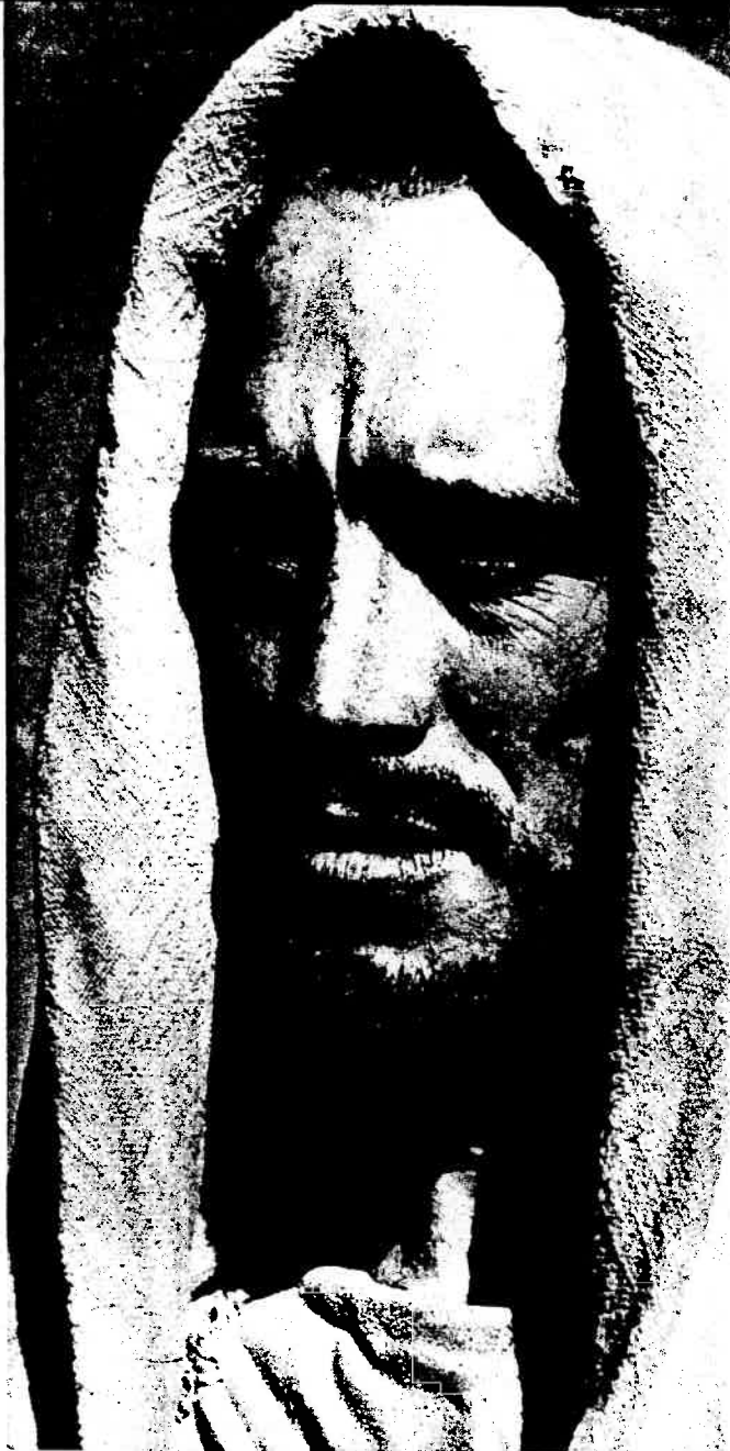
L'attore Max Von Sydow che interpreta in modo eccellente la figura di Gesù.

Gesù, anche ai più intimi, appare come circondato da un fascino misterioso. Tale fascino esaltante e sovrumano ha infiammato le menti durante i secoli ed è sfociato nell'ardente fervore di fede che Egli solo sa ispirare.