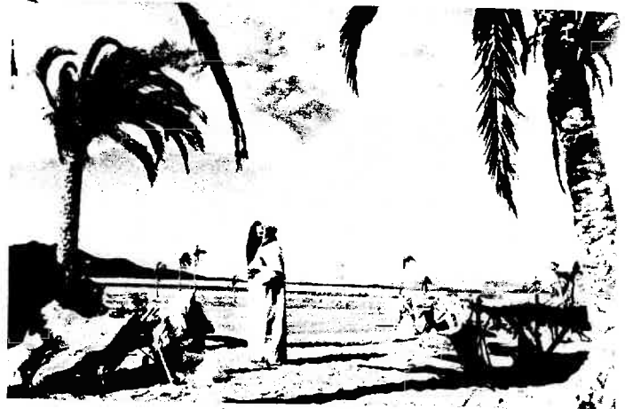
Giuseppe con Maria, che ha il Bambino Gesù in braccio, giungono in Egitto per sfuggire ad Erode. In fondo le piramidi.

È il film più grandioso che sia mai stato realizzato sulla vita di Cristo, ma con fedeltà accurata al Vangelo. Vi partecipano i più noti attori del mondo.