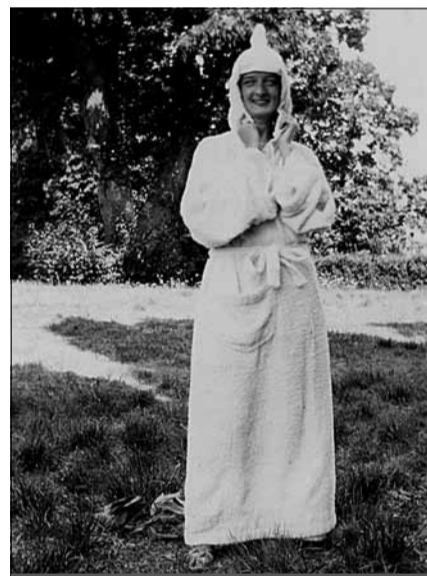
Mamma Gemetta in accappatoio ai Bagni di Bormio

Fellini lo ricordo nel 1979, sul set di La città delle donne , avvolto dai fumosi del set mentre spiega una scena a Mastroianni circondato da ragazze un po' punk. Altro momento elettrizzante fu quando mio padre mi chiamò da casa di Federico che, saputo che a vent'anni non avevo ancora fatto l'amore cercò, senza riuscirci molto, di rassicurarmi dicendo: "Guardalo come un fatto araldico, nobile". Ricordo ancora Fellini quando, giustamente, si stupì, quasi irritandosi ma anche divertendosi, durante un mio maldestro tentativo di intervistarlo. Mi ingiunse infatti di fargli delle domande che si farebbero a una persona come tutte le altre, e non come a un marziano! Ricordo anche quando rispondeva al telefono fingendosi