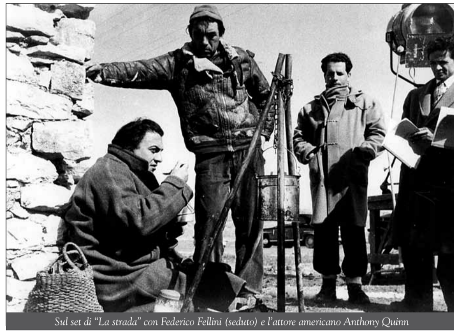
Sul set di "La strada" con Federico Fellini (seduto) e l'attore americano Anthony Quinn